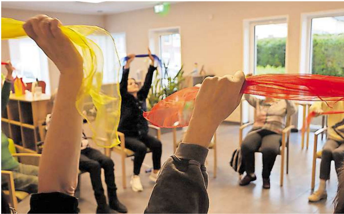
Beim Sitztanz mit Tüchern kommen die Senioren der Tagespflege Belle Fleur in Bitburg in Schwung. Die Übungen sind anstrengender als man bei bloßem Zuschauen meinen könnte.