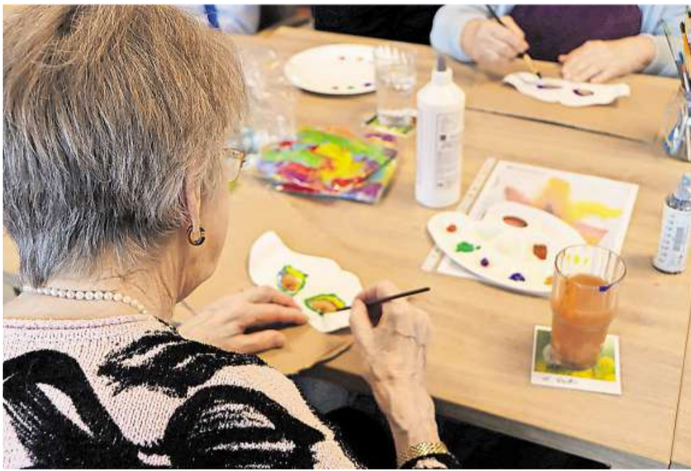
Masken anmalen ist einer von vielen Programm punkten in der Bitburger Tagespflege Belle Fleur.

Karneval verbinden. Bei einigen kommen Kindheitserinnerungen, ein Mann hat als Vorsitzender des